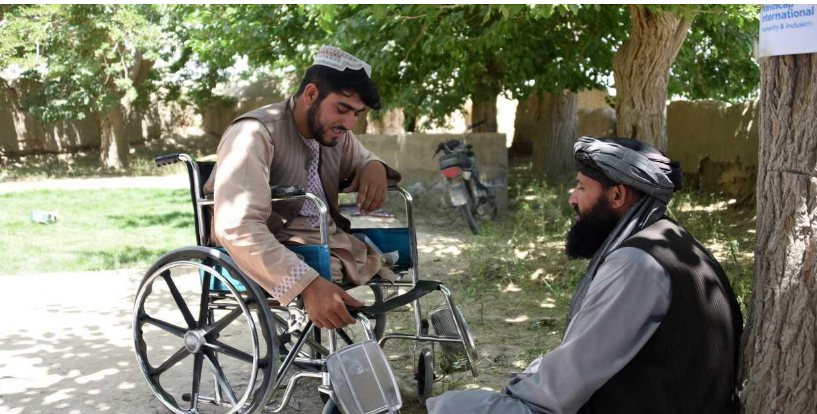
ФОТО ВНИЗУ: Цей чоловік, який отримав каліцтво у результаті нещасного випадку з вибухонебезпечними предметами в Афганістані, отримав послуги з фізичної реабілітації та лікування у зв'язку з м'язовою слабкістю.

23 МСПМД 13.10 вимагає, щоб всі оператори з розмінування ділилися з відповідною державною організацією даних про постраждалих і тим, що їм відомо про потреби ідентифікованих постраждалих і про інших людей з подібними потребами. Точно так само рекомендується ділитися такими даними з іншими особами, які здійснюють діяльність в секторах, куди відноситься VA, щоб задіяти більш широку багатосекторну підтримку і донорів. В такому випадку може мати місце неформальне партнерство і загальне надання інформації, без посилання на окремих осіб, що надається організації, яка надає послуги - таким чином, особа, яка здійснює діяльність з розмінування, не має коштів, щоб перевірити, послідовно чи надається доступ до послуг і надходять чи вони до окремих осіб, яким надається допомога, і, таким чином, особи, які отримують допомогу від цих видів діяльності, розглядаються як непрямі бенефіціари при VA.