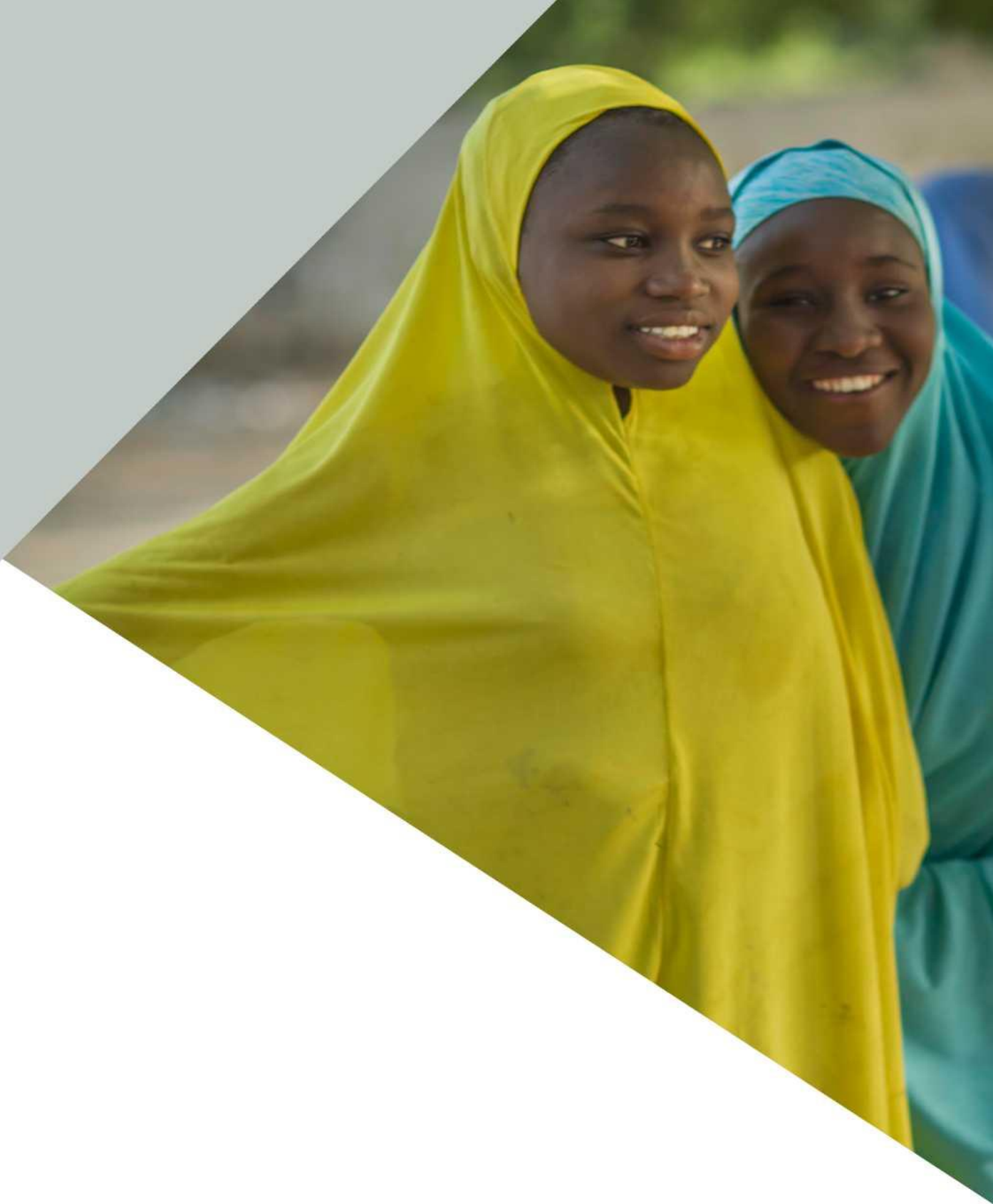
ФОТО ЗВЕРХУ: Молоді жінки в селі Нгамарі, Нігерія