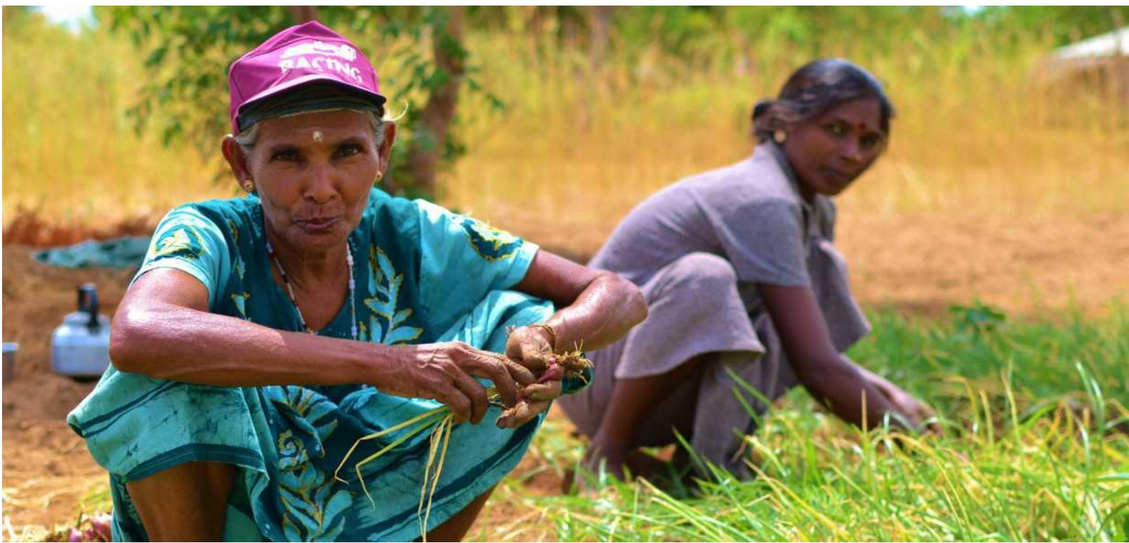
ФОТО ПРАВОРУЧ: Життя в Південному Судані на території, яка деякий час тому була замінована

ФОТО ВНИЗУ: Збір урожаю цибулі на розчищеній земельній ділянці в Шрі-Ланці