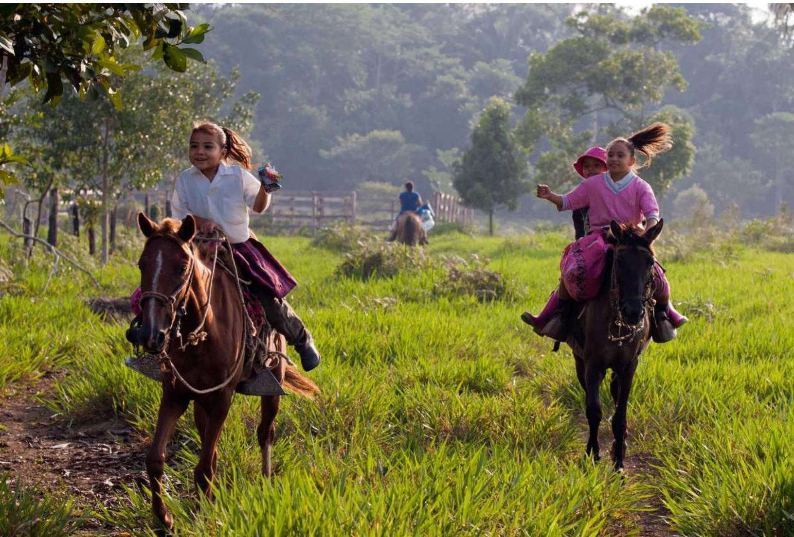
ФОТО ЗВЕРХУ: Діти з початкової школи Санта-Хелена на конях рано вранці. Деякі з цих дітей приїжджають з місць, які знаходяться в двох годинах їзди звідси. Санта-Хелена, район Мета, Колумбія.