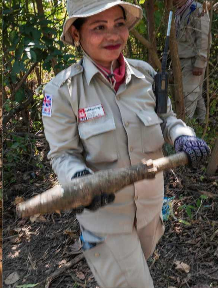
ФОТО ЗВЕРХУ: Команда EOD перевіряє реактивно-протитанкову гранату і мінометні міни, які ця жінка-бенефіціар з Камбоджі і її чоловік знайшли у себе в полі, перед їх безпечним витяганням для знищення в іншому місці.