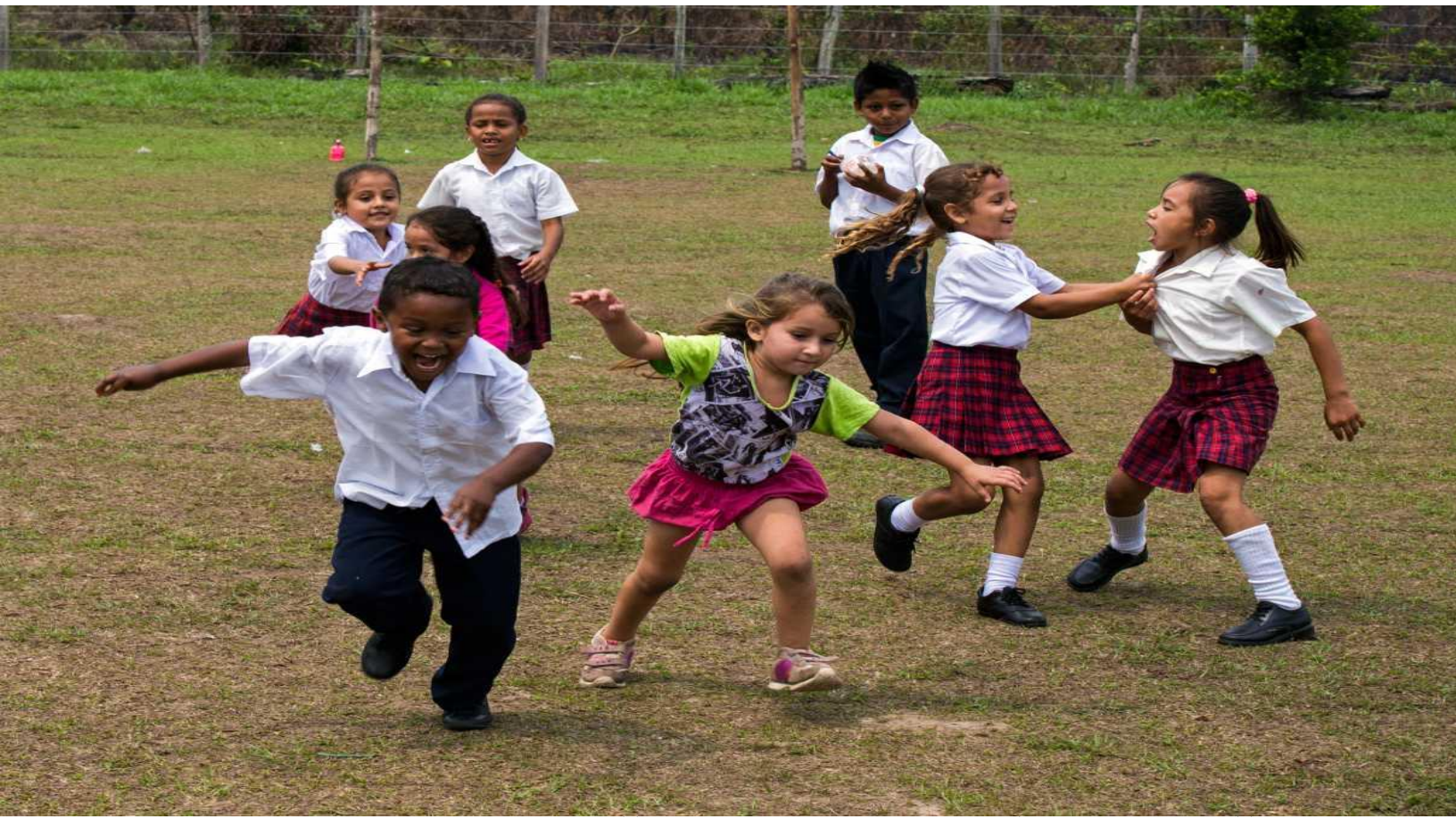
ФОТО ВНИЗУ: Діти грають на шкільному подвір'ї початкової школи, Санта-Хелена, Мета, Колумбія