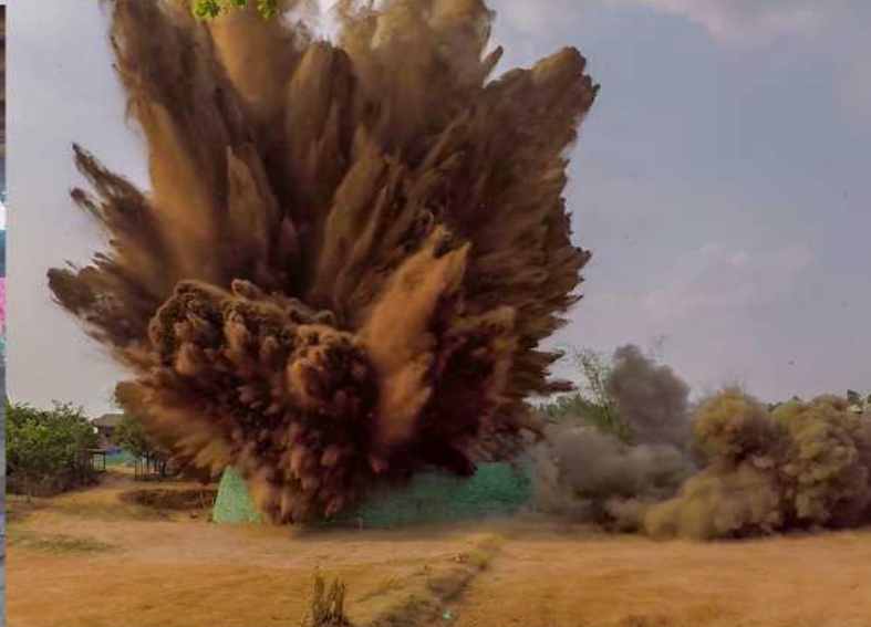
ФОТО ЗВЕРХУ (за годинниковою стрілкою від верхнього лівого краю): сільські жителі в Нонсомбауме, Лаос, наповнюють мішки піском як частини захисних робіт, в яких виникла нВНПбхідність, коли в поле на краю їх села була знайдена велика авіабомба. Знищення бомби усунуло істотну загрозу для жителів села, які тепер можуть брати участь в щоденних справах без страху.