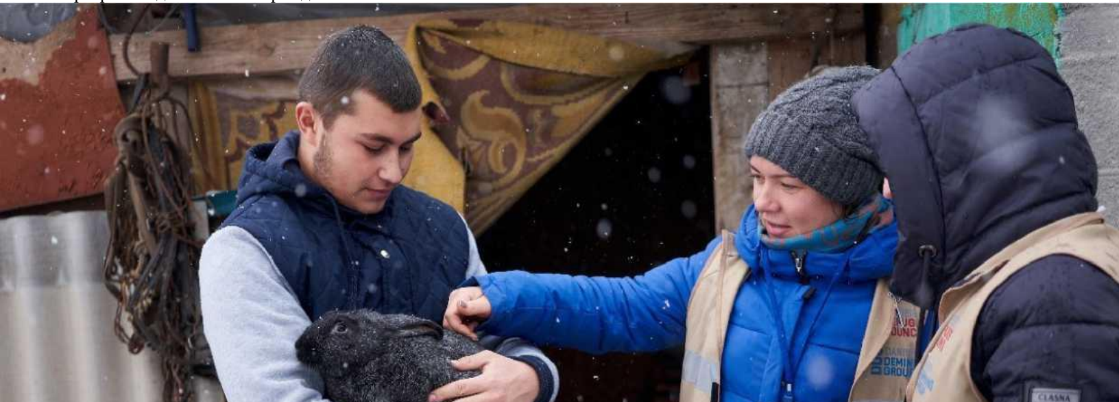
ФОТО ВНИЗУ: Цей підліток втратив три пальці правої руки в результаті інциденту, пов'язаного з вибухом на сході України в 2017 р. Незважаючи на обмежене використання руки, він зміг продовжити свої заняття після того, як придбав леп-топ за програмою допомоги постраждалим.