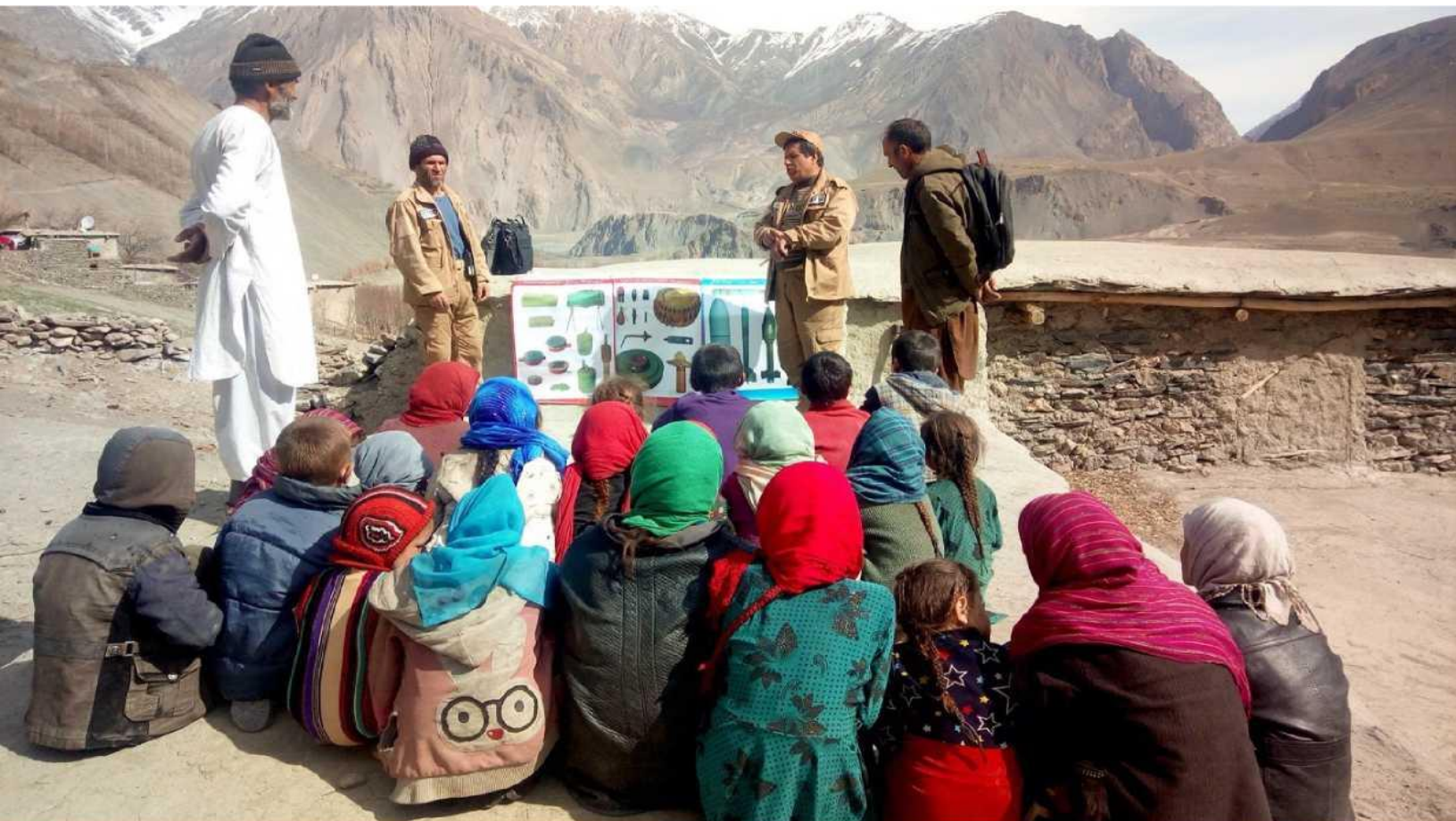
ФОТО ЗВЕРХУ: гористий регіон Дарваз на північному сході Афганістану досі сильно забруднений протипіхотними мінами. Ці діти з села Джанмарж Бала повинні знати, як розпізнати вибухонебезпечні залишки війни і не підходити до них під час гри на вулиці.

При описі охоплення і впливу на макрорівні або у випадках, коли безпосередній збір інформації про осіб з обмеженими можливостями є закритим або нездійсненним з інших причин, дані можна отримати з державних чи інших другорядних джерел.