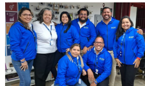
OIM. Capacitación para facilitadores de la OIM en materia de protección y detección, identificación, derivación y asistencia de posibles casos de trata de personas en Caracas.