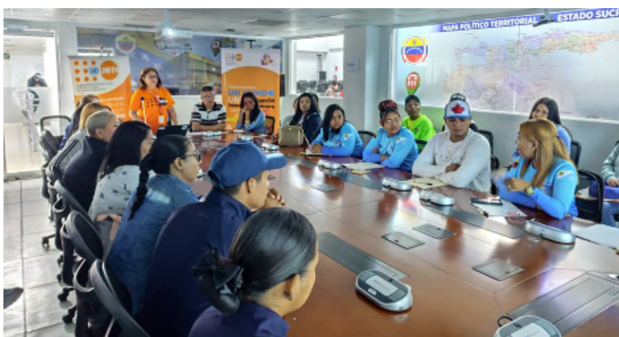
UNFPA. Taller con personal de instituciones públicas sobre violencia sexual y prevención de trata de adolescentes y mujeres con fines de explotación sexual, estado Sucre.

En Maracaibo, estado Zulia, el taller convocó al personal del Instituto Municipal de la Mujer e Igualdad de Género y del Instituto Municipal para la Sexodiversidad. El taller en el estado Apure se centró en la prevención comunitaria y estuvo enfocado en la formación a líderes de la parroquia San Camilo, en el municipio Páez. En total, estas acciones sumaron 20 horas de formación y alcanzaron a 67 personas, 59 mujeres y 8 hombres.