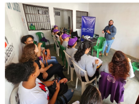
OIM. Capacitación en Trata de personas en contextos de emergencia con el personal de CEDESEX, Mujeres empoderadas y CESDIEM, estado Falcón.