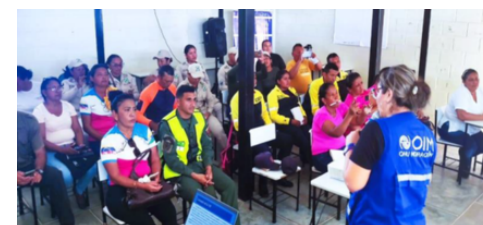
OIM. Capacitación detección, identificación, derivación y asistencia a posibles víctimas de trata de personas en San Fernando, estado Apure.

En septiembre de 2024, la OIM realizó durante 2 días, la capacitación para facilitadores de la OIM en materia de protección y detección, identificación, derivación y asistencia de posibles casos de trata de personas, con el fin de fortalecer las capacidades técnicas internas, abordando temas asociados a la trata de personas con las valoraciones y medidas de seguridad, la formación de facilitadores, el enfoque de la OIM en materia de protección; detección, identificación, derivación y asistencia a víctimas de trata de personas y Línea de Contacto de las Naciones Unidas.