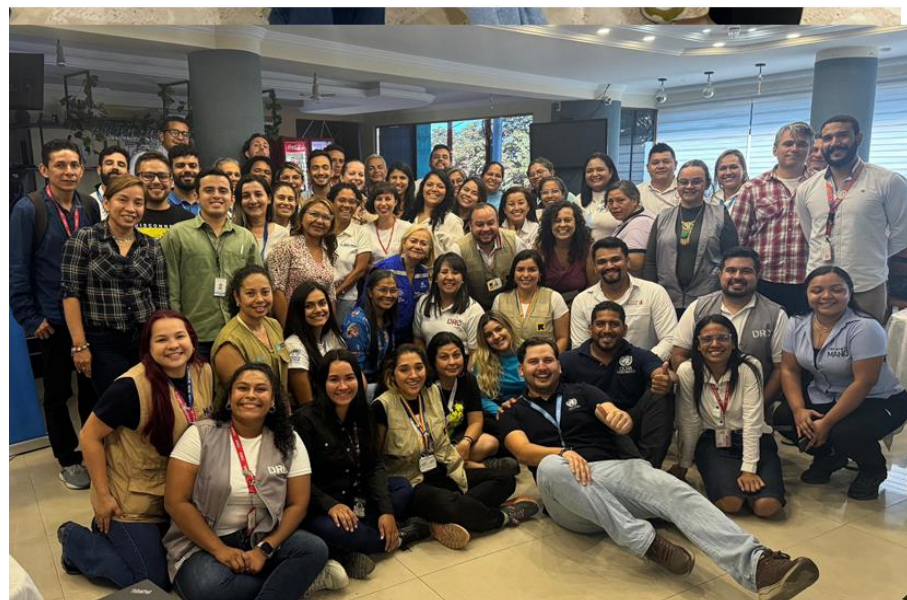
Talleres de Necesidades en Terreno. (2024)