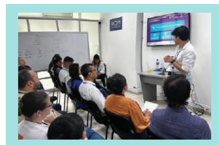
Imagen: Subsector Trata y tráfico

El Subsector de Trata y Tráfico avanzó en acciones de apoyo técnico a los territorios. En Cúcuta, se llevó a cabo una sesión de trabajo con la coordinación del Sector Local de Protección del GIFMM. El objetivo fue iniciar la elaboración de un documento de referencia técnica que permita activar la ruta nacional de protección y asistencia a víctimas de trata de personas y fortalecer la coordinación con las autoridades locales.