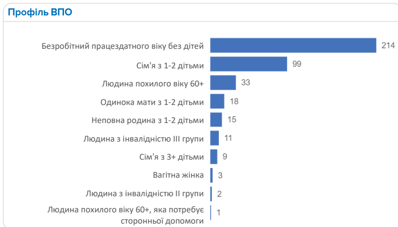
МАЛЮНОК 4: ПРОФІЛЬ ВПО - РЕСПОНДЕНТИ НЕ МАЮТЬ ПРАВА НА АВТОМАТИЧНЕ ПРОДОВЖЕННЯ

15% ВПО (468/3,031), які звернулися до партнерів, не відповідали критеріям для продовження допомоги. 42% з них звернулися з проханням про продовження допомоги, і більшість з них вже отримали відмову, тоді як 17% все ще очікують рішення. З тих, кому було запропоновано надати додаткові документи, 21% не змогли їх надати, а 13% потребували допомоги. Більшість - безробітні працездатного віку та сім'ї з 1-2 дітьми. Профілі вразливості включають переважно людей, чий дохід перевищує встановлений мінімум для отримання допомоги, але є недостатнім для покриття орендної плати та витрат на проживання.