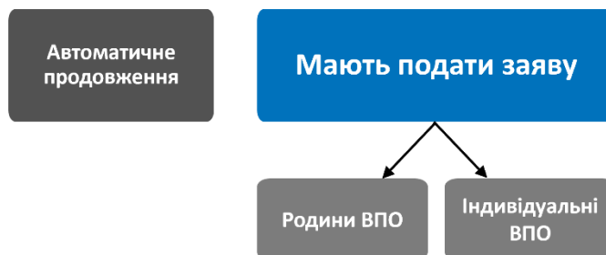
МАЛЮНОК 3: КАТЕГОРІЇ ВІДПОВІДНОСТІ КРИТЕРІЯМ ДЛЯ ОТРИМАННЯ ДОПОМОГИ ВПО

З 3,031 опитаних 42% (1,284/3,031) вважають себе такими, що мають право на автоматичне продовження . Більшість з цих ВПО мали інвалідність або були літніми людьми, включаючи тих, хто потребує стороннього догляду. Хоча подання заяви для цієї категорії ВПО не вимагається, 23% повідомили, що подали заявку на продовження виплат, і 4% було відмовлено. Основними причинами відмови є те, що пенсія перевищує 9,444 грн., а також