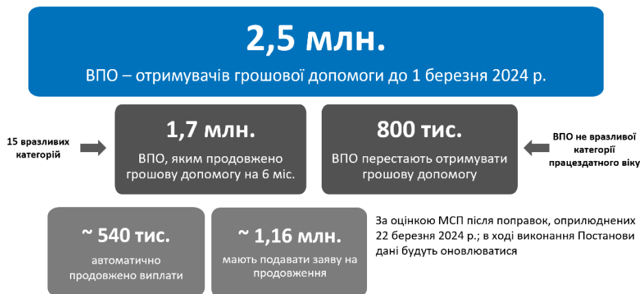
МАЛЮНОК 1: РЕЗОЛЮЦІЯ 332: ВПО ПОСТРАЖДАЛИ – КЛЮЧОВІ ЦИФРИ

За попередньою оцінкою, наданою МСП 26 квітня 2024 року, з близько 2,5 мільйонів ВПО, які отримували грошову допомогу для ВПО до 29 лютого 2024 року, станом на 1 березня майже 1,5-1,7 мільйона ВПО з вразливих категорій матимуть право на продовження допомоги ВПО (близько 540,000 - на автоматичне продовження та близько 1-1,2 мільйона - після повторного подання заяви про продовження виплати). Майже 800,000 - 1 млн. ВПО працездатного віку, які не належать до вразливих категорій, з 1 березня не отримуватимуть допомогу. На момент підготовки даного документу загалом 961,000 ВПО, які відповідають критеріям, продовжували отримувати грошову допомогу для ВПО в результаті або автоматичного продовження, або після повторного подання заяви про продовження виплати.