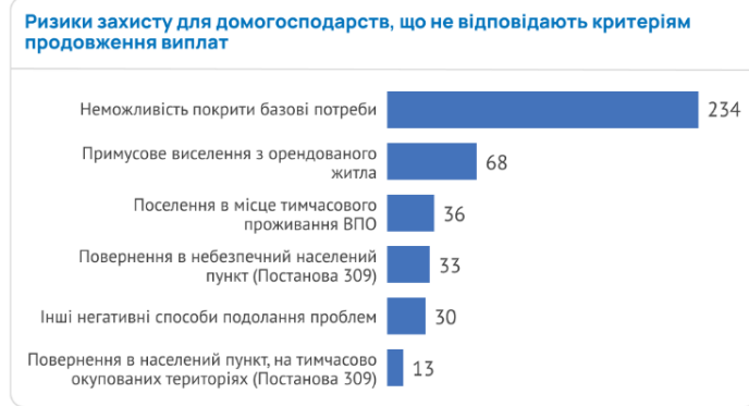
РИСУНОК 5: ОГЛЯД РИЗИКІВ ЗАХИСТУ

Основним ризиком захисту, про який повідомили респонденти, які постраждали від зміни політики щодо виплат (тобто повинні були подати заяву на продовження, або які більше не мають права на допомогу), була нездатність задовольнити базові потреби, що корелюється з висновками багатосекторальної оцінки потреб 2023 року, висвітленими REACH 3 , про те, що ВПО було важко покрити свої основні потреби ще до впровадження змін у виплаті допомоги ВПО. Для тих, хто більше не має можливості отримувати грошову допомогу для ВПО, цей ризик ще більше посилюється. Другим звітаним ризиком захисту є виселення з