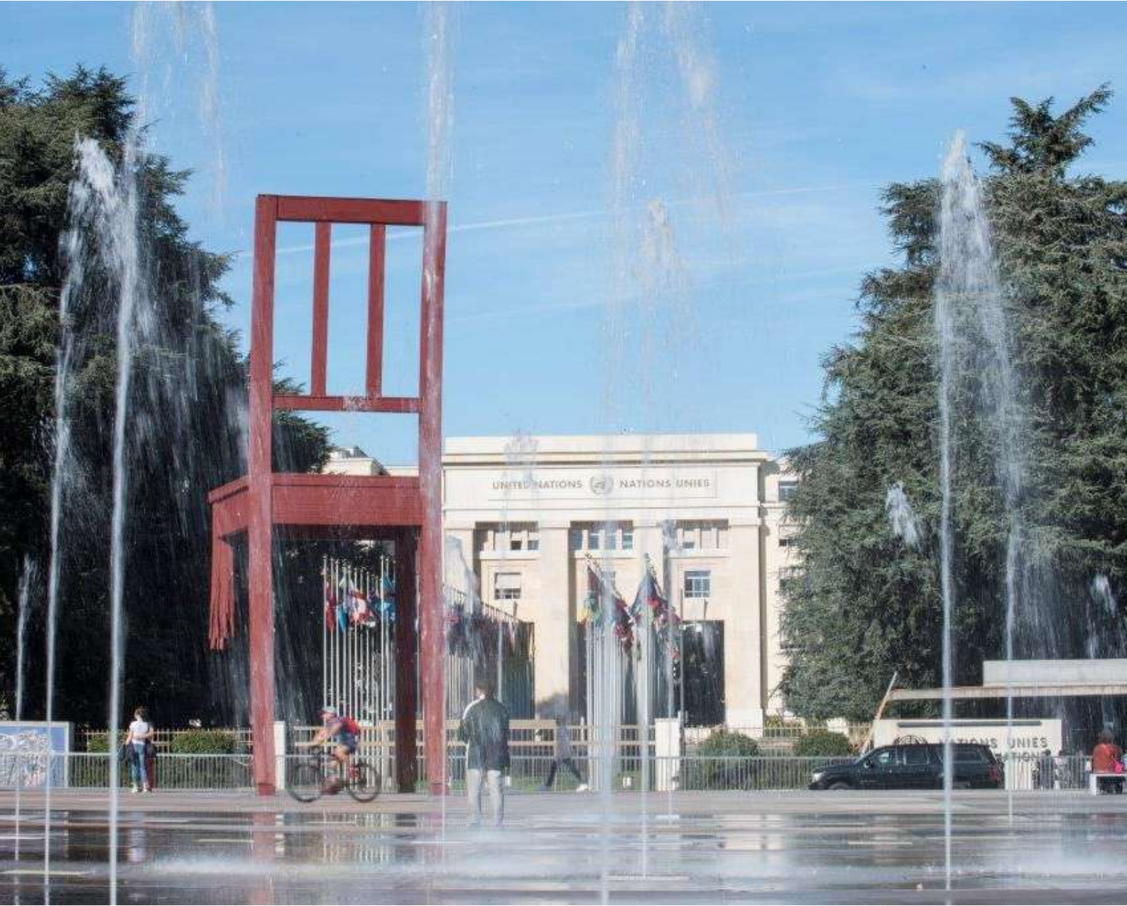
"المقعد المكسور"، الجانب المقابل لقصر الأمم المتحدة في جنيف، سويسرا.

"يجب زيادة تمويل استجابات الحماية، بما في ذلك من خلال المجموعة الفرعية المعنية بمسؤوليات الأعمال المتعلقة بالألغام ضمن المجموعة العالمية للحماية".