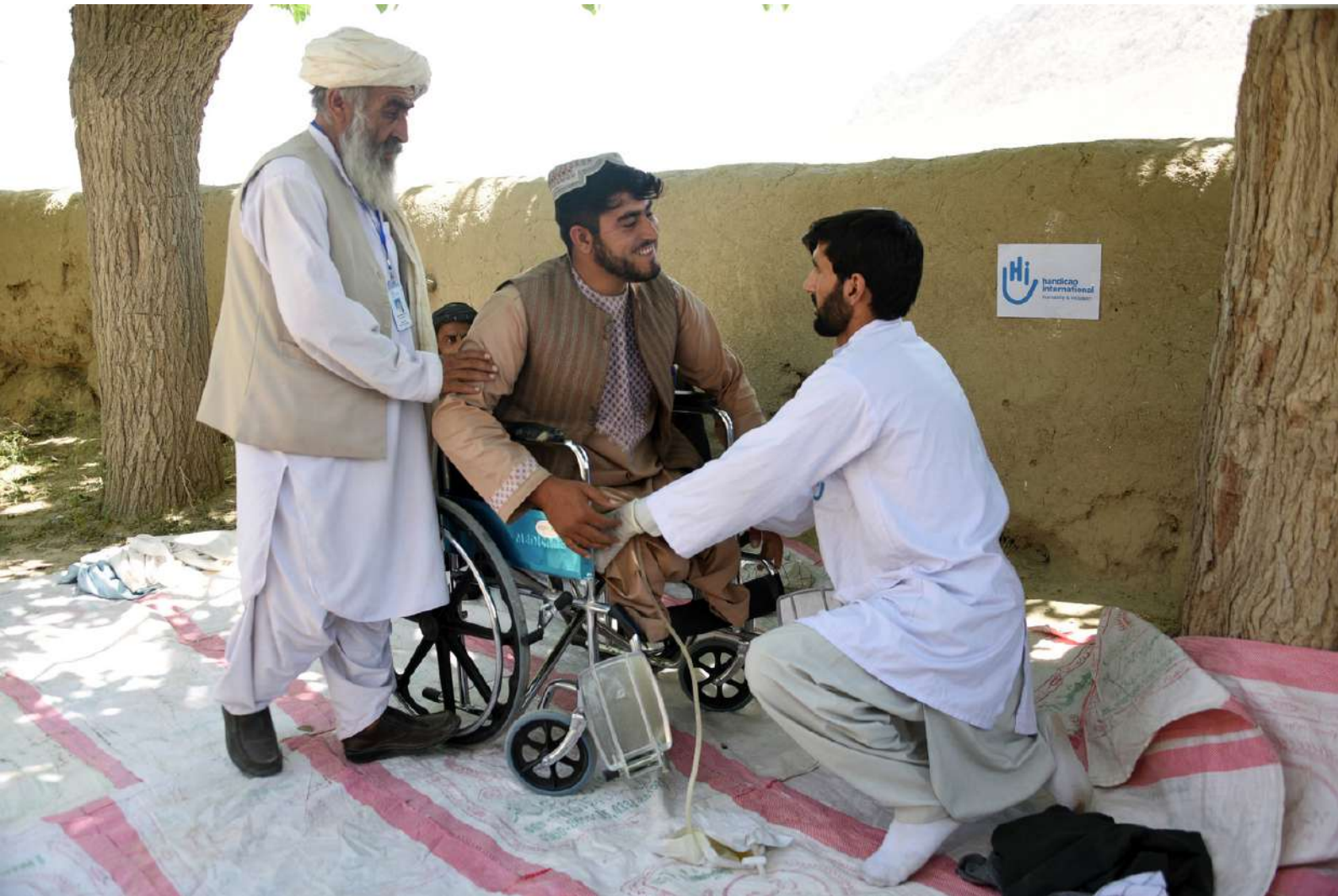
مساعدة الضحايا في أفغانستان صورة: العمل الإنساني والإدماج