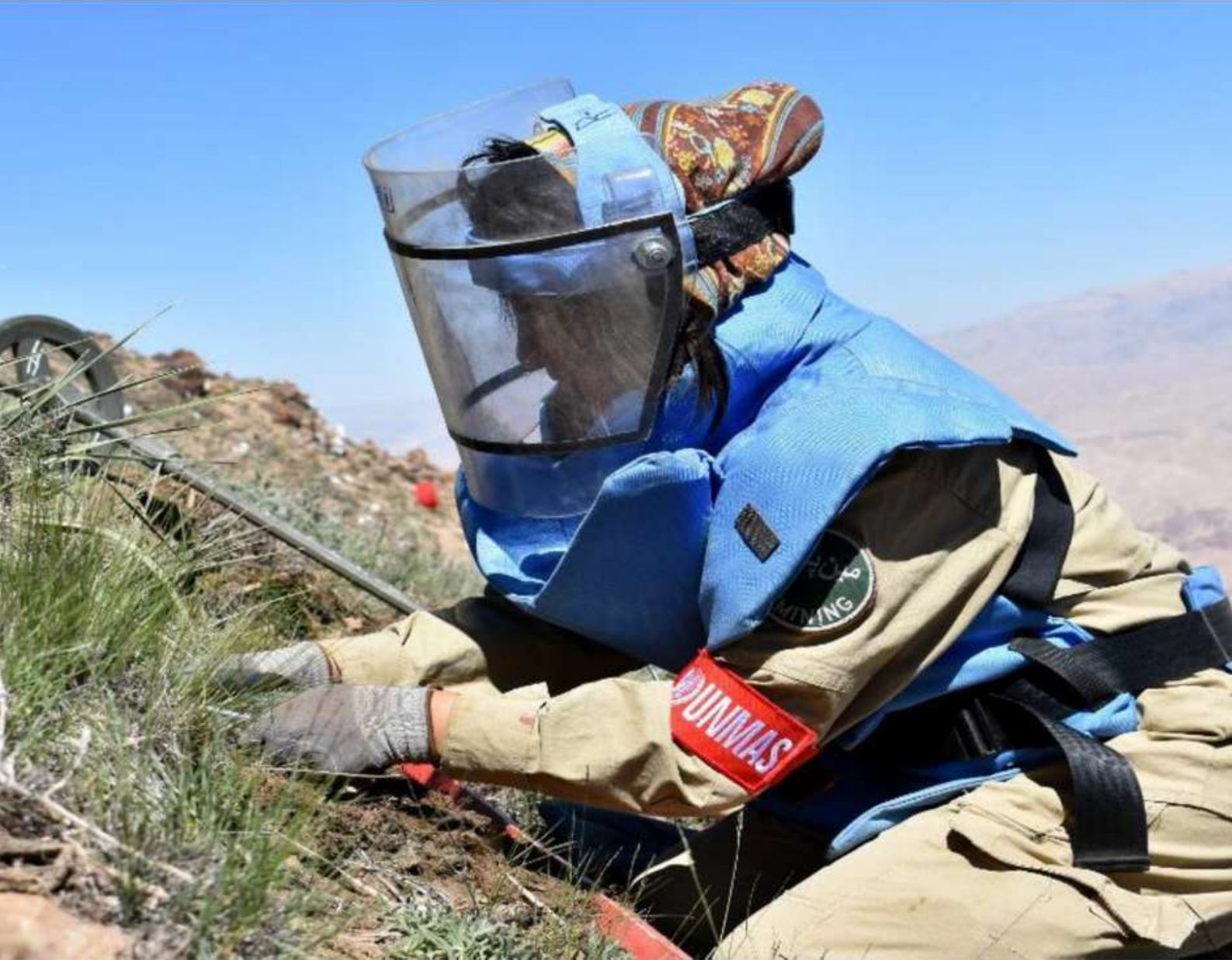
أخصائي إزالة الألغام في أفغانستان.

حماية الأشخاص من مخاطر الانفجارات في حالة الطوارئ الإنسانية: الترويج لحلول شاملة ومحلية ودائمة