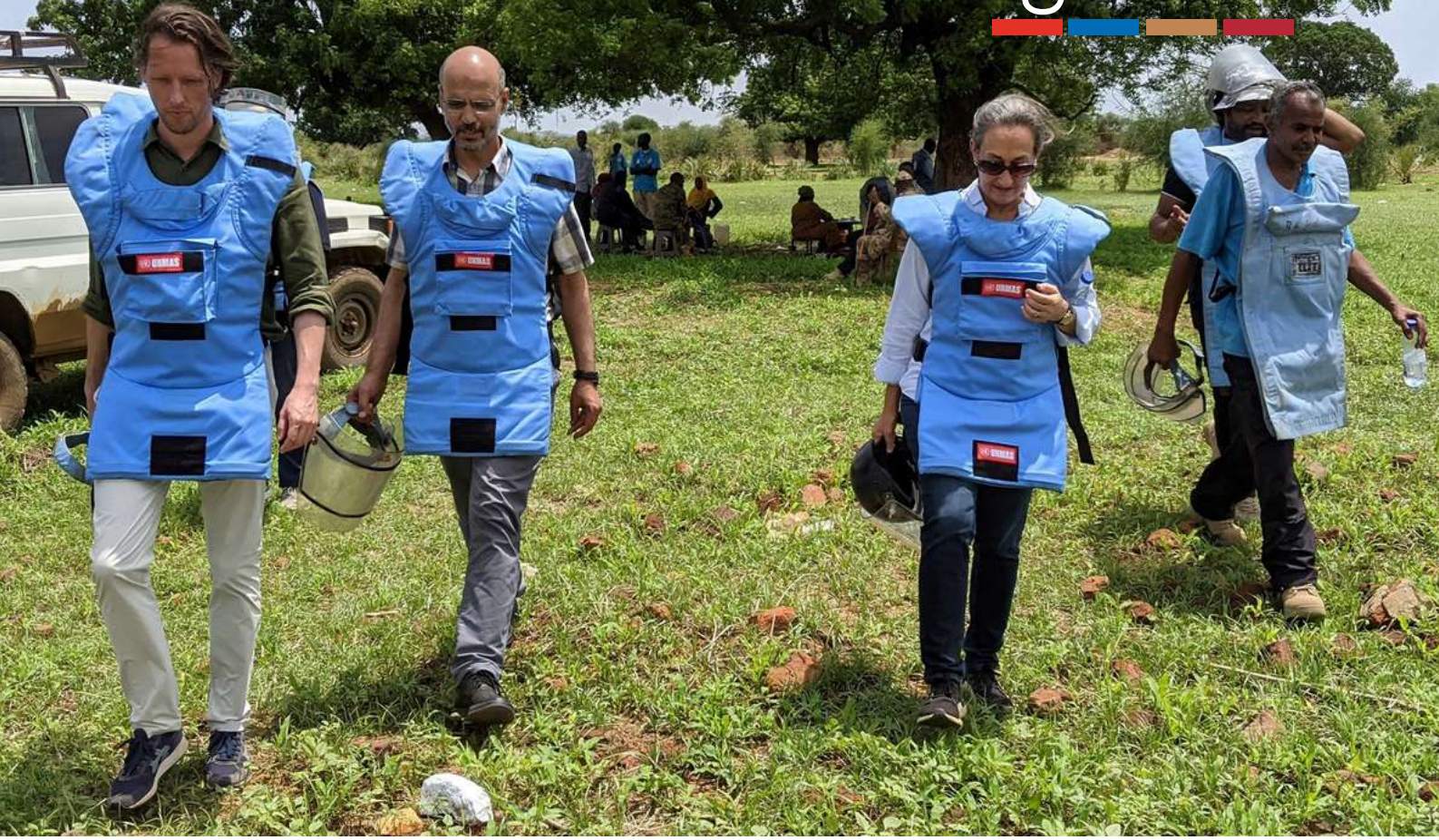
مديرة دائرة الأمم المتحدة للأعمال المتعلقة بالألغام بالإنابة، إيلين كوهن، تزور عمليات دائرة الأمم المتحدة للأعمال المتعلقة بالألغام في السودان، يونيو 2021.