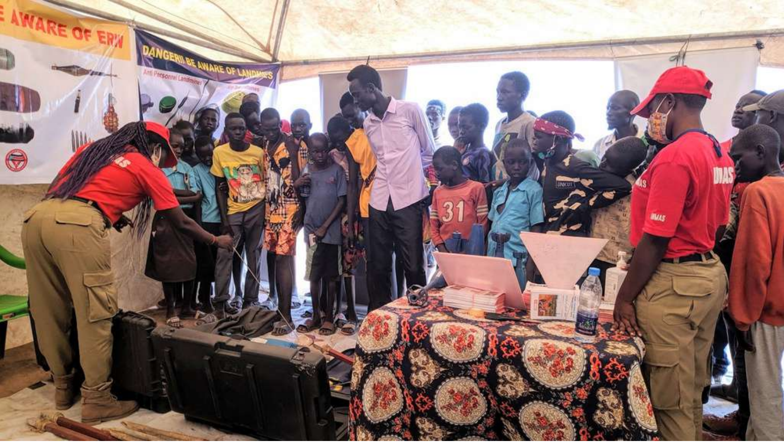
جلسة التوعية بخطر الذخائر المتفجرة (EORE) التي تقيّمها دائرة الأمم المتحدة للأعمال المتعلقة بالألغام (UNMAS) بالشراكة مع منظمة الأغذية والزراعة (الفاو) في واراب، جنوب السودان، نوفمبر 2021.