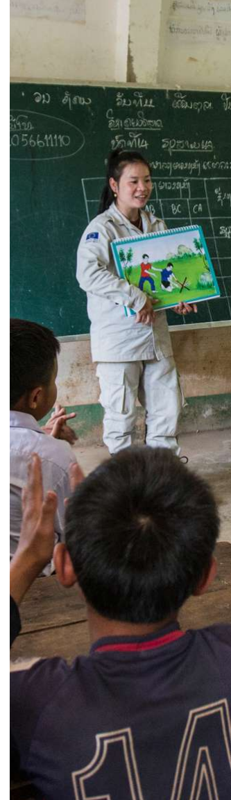
التوعية بالمخاطر في لاوس. صورة. العمل الإنساني والإدماج