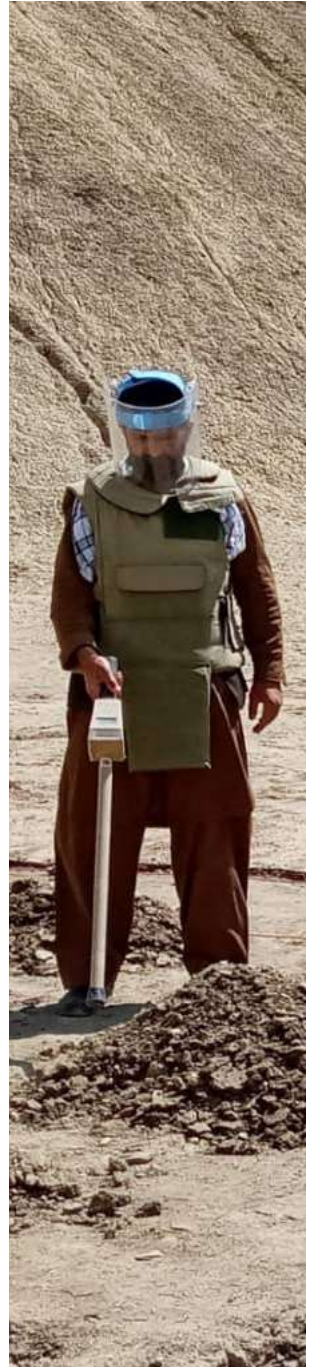
إزالة الألغام في أفغانستان.