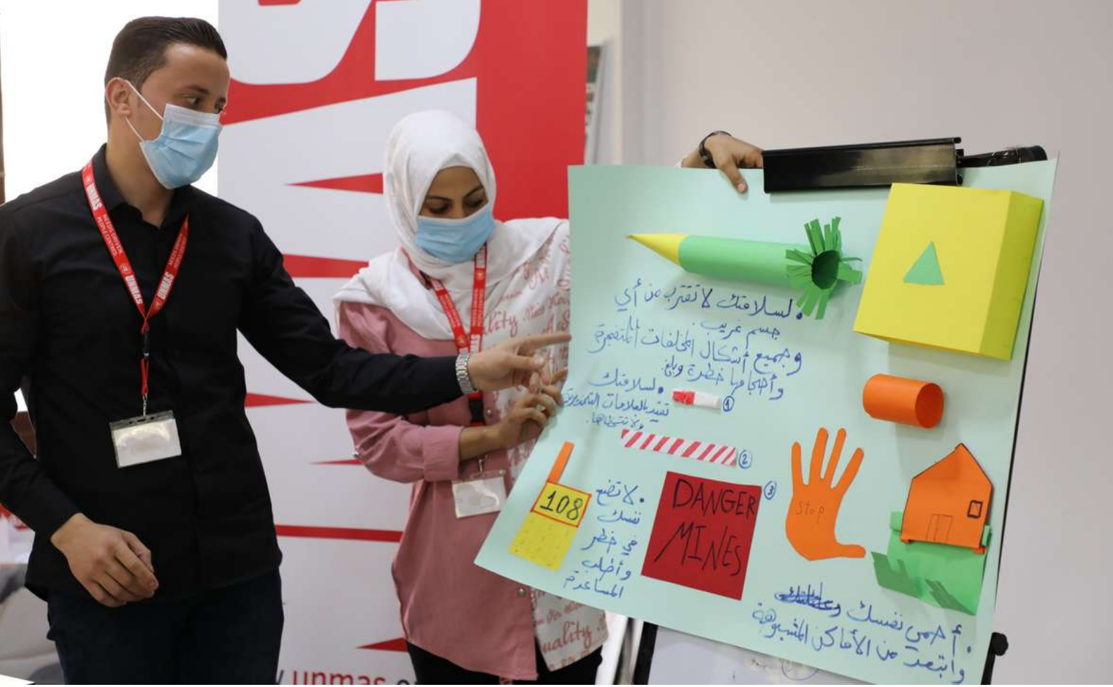
جلسة توعية عن الذخائر المتفجرة مع الزملاء في مجالات العمل الإنساني في دمشق، سوريا، نوفمبر 2021، صورة حقوق ملكيتها محفوظة للأمم المتحدة/فرانثيسكا شياوداني.