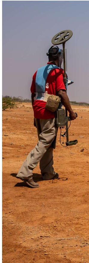
إزالة الألغام في الصومال.