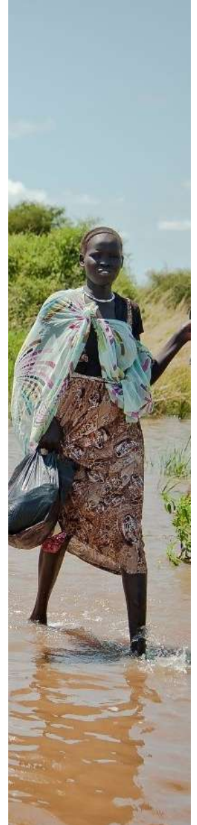
تغير المناخ: الفيضان.