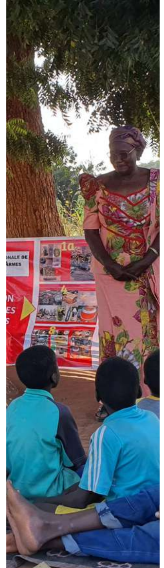
تعقد جمعية AMMIE جلسة توعية حول المخاطر مع المجتمع المحلي في كورسيمورو، في بوركينا فاسو. أكتوبر 2021