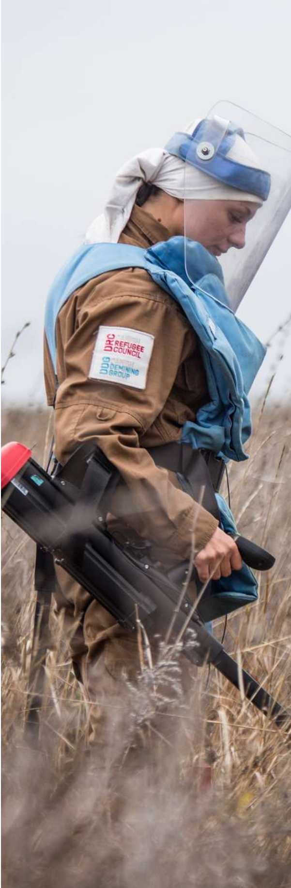
أخصائي إزالة الألغام في أوكرانيا

يتمثل الغرض من هذه الإستراتيجية، وهي الأولى من نوعها، في تقديم جدول أعمال جماعي توافق عليه أعضاء المجموعة الفرعية العالمية المعنية بمسؤوليات الأعمال المتعلقة بالألغام (MA AoR). وهي تعد مكملة لإجراءات التشغيل القياسية الفنية (SOPs) الخاصة بالمجموعة الفرعية العالمية المعنية بمسؤوليات الأعمال المتعلقة بالألغام (MA AoR). تركز هذه الاستراتيجية على رؤية استراتيجية الأمم المتحدة للإجراءات المتعلقة بالألغام للفترة 2019-2023 المتمثلة في "عالم خالٍ من تهديد الألغام والمتفجرات من مخلفات الحرب، بما في ذلك الذخائر العنقودية والمتفجرات يدوية الصنع حيث يعيش الأفراد والمجتمعات في بيئة آمنة موثوقة على تحقيق السلام والتنمية المستدامين" وعلى رؤية الإطار الاستراتيجي العالمي لمجموعة الحماية للفترة 2020-2024 حيث تتم توفير الحماية للناس في الأزمات الإنسانية واحترام حقوقهم وإيجاد الحلول لهم وفقاً للقانون الدولي".