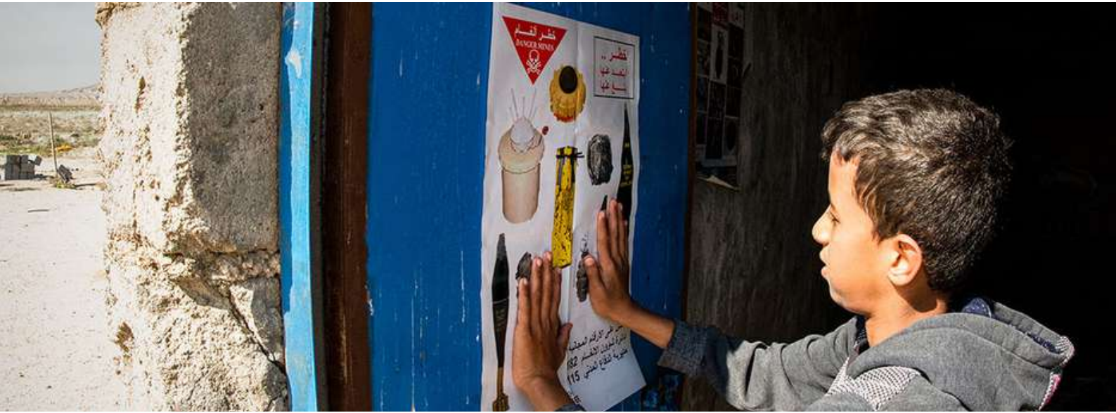
التوعية بمخاطر الألغام في البصرة بالعراق.

يتم الاستعانة بالمبادئ التالية لتوجيه المجموعة الفرعية المعنية بمسؤوليات الأعمال المتعلقة بالألغام وتنفيذ هذه الإستراتيجية: