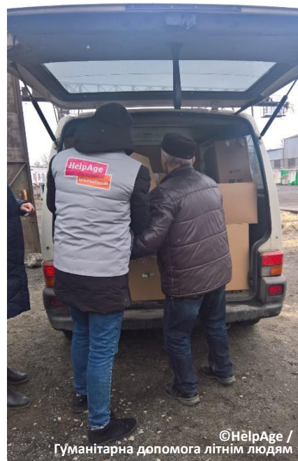
Гуманітарна допомога літнім людям