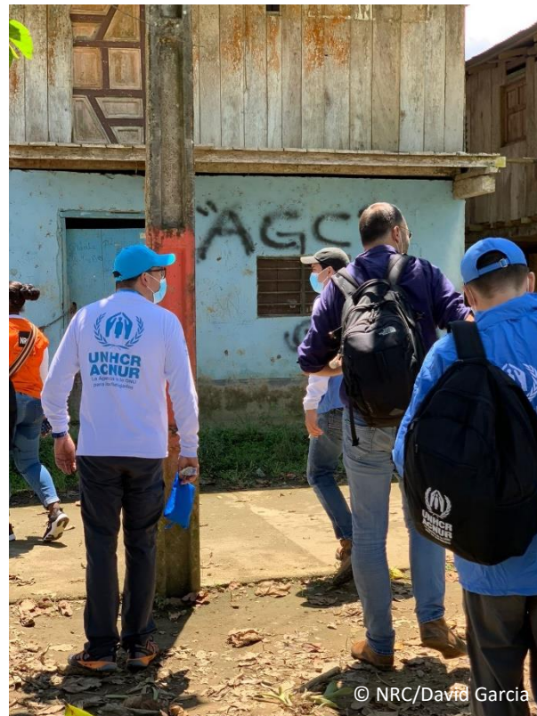
Equipo de la misión del Clúster Mundial sobre Protección durante una visita sobre el terreno, en septiembre de 2021

El apoyo a los asociados locales, a las autoridades y a las comunidades de Colombia es fundamental para conseguir, acceder y mantener el impacto humanitario y la respuesta de protección, así como para encontrar soluciones duraderas que aborden las causas profundas del desplazamiento. Este enfoque debería ser fundamental en la labor humanitaria en Colombia.