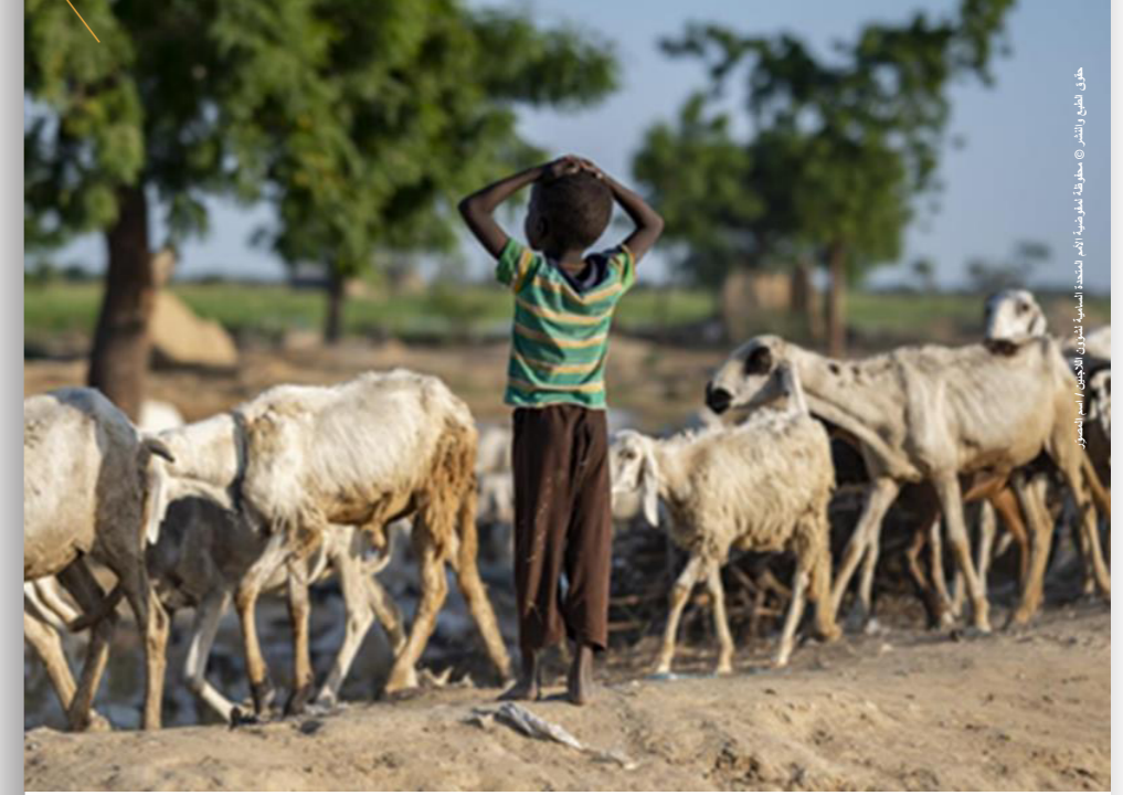
عزل لطف ريشو © مطوقا لعموم، الأمم المتحدة، السورامي، لبنان، كانون الأول/ديسمبر ٢٠٢٢